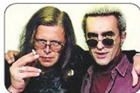
1997 г. С Борисом Гребенчиковым. Песня «Нежный вампир».