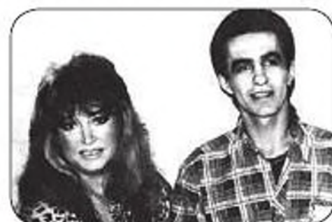
1988 г. С Аллой Пугачевой. Песня «Доктор твоего тела».