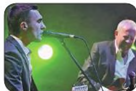
2010 г. С Андреем Макаревичем. Песня «Титаник».