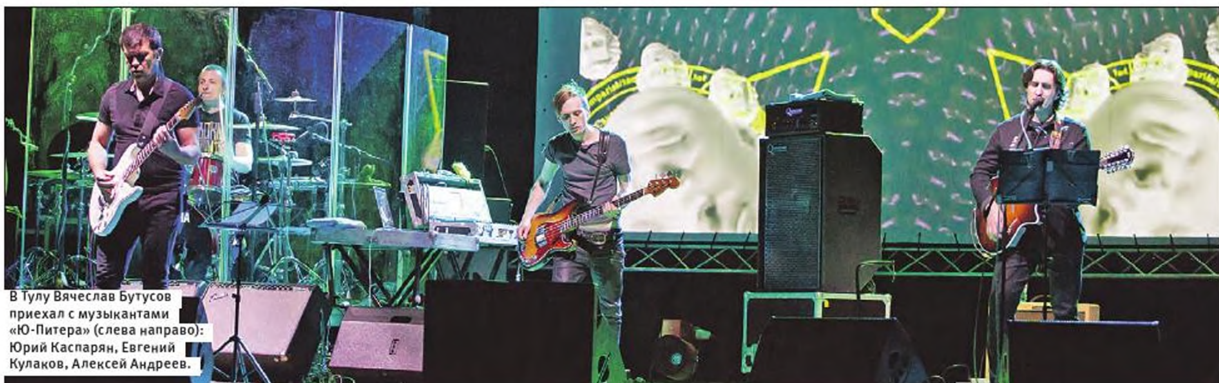
В Тулу Вячеслав Бутусов приехал с музыкантами «Ю-Питера» (слева направо): Юрий Каспарян, Евгений Кулаков, Алексей Андреев.