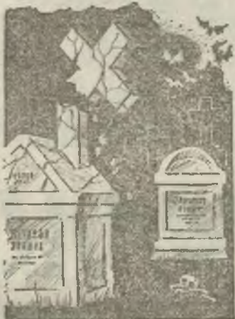
трэш-сейшена провел в милицейской кутузке с раскормленным попом черепом. Искусство требует жертв!

Треш-маньяков Питера и Северо-Запада России не остановили даже пятидесятирублевые билеты. Полный устал Кетати, автор этих строк всю ночь после