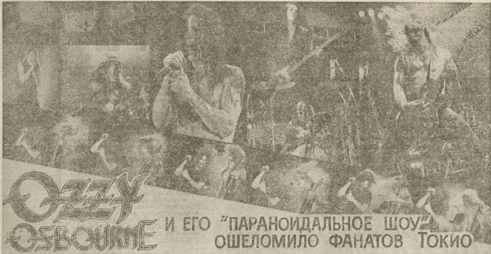
И ЕГО "ПАРАНОИДАЛЬНОЕ ШОУ" ОШЕЛОМИЛО ФАНАТОВ ТОКИО